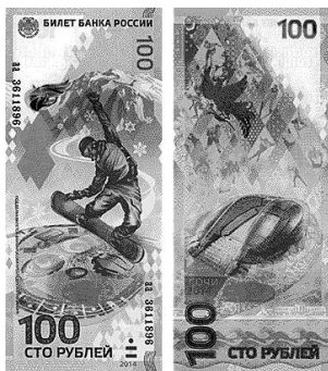
100 ruble bill